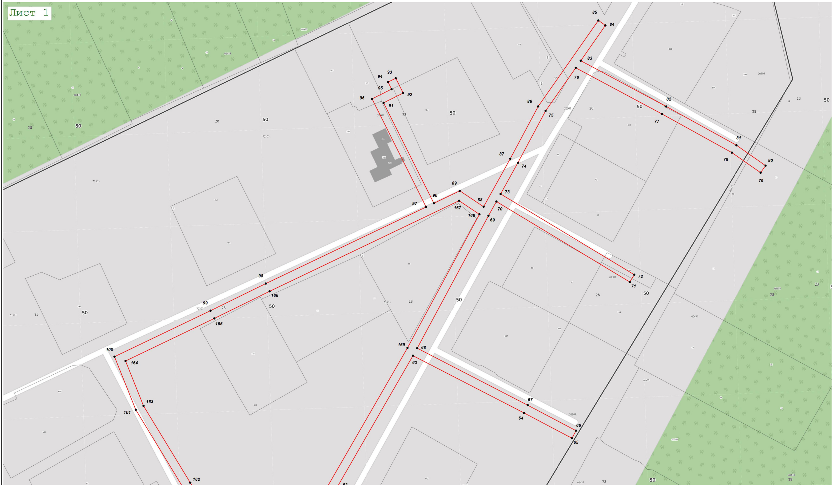
Масштаб 1:1 000